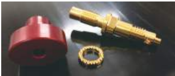
Borne haut-parleur YG Acoustics terminée.