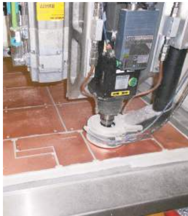
Circuits imprimés usinés sur place.