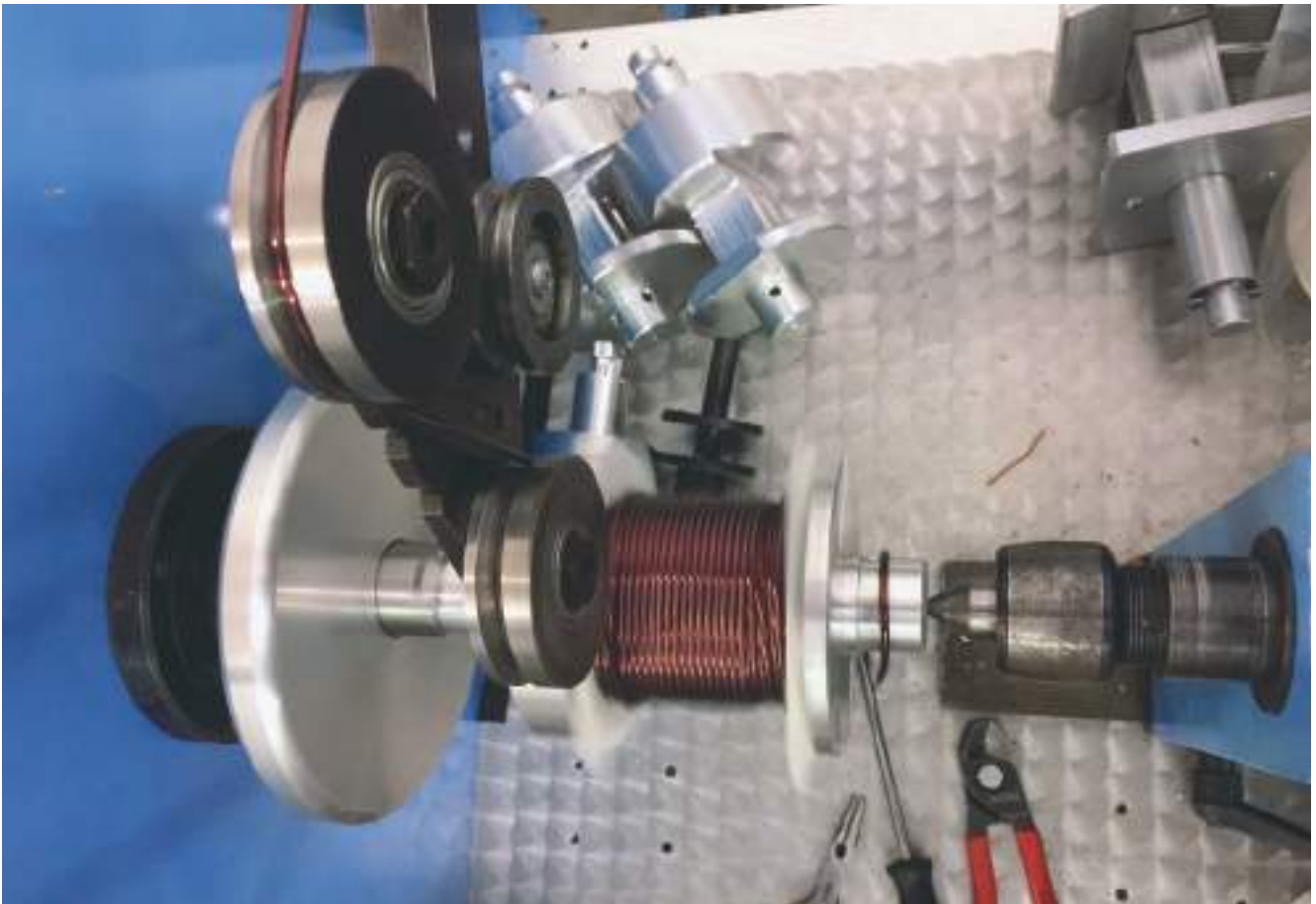
Inductances de filtres de grave produites en interne.