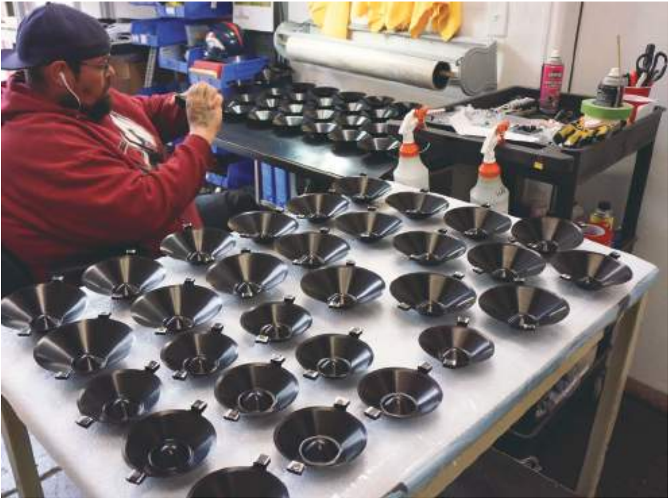
Cônes de médium/woofer anodisés en cours d'inspection.