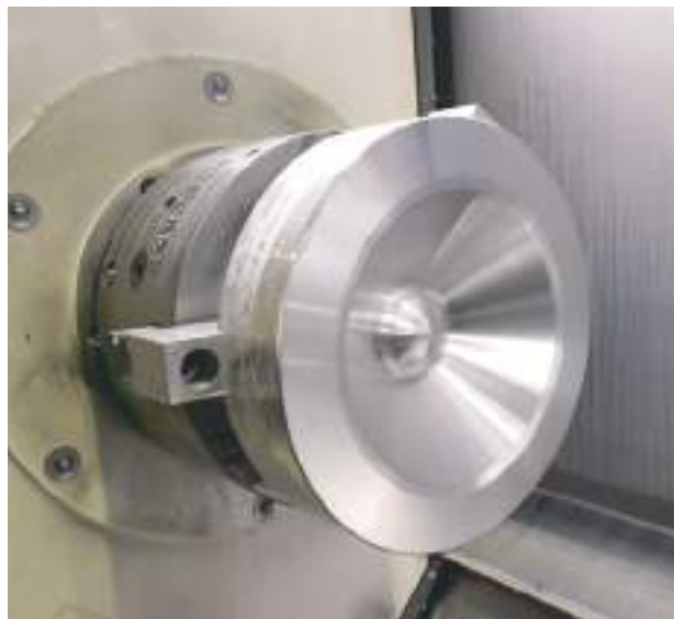
Cône de woofer partiellement usiné.