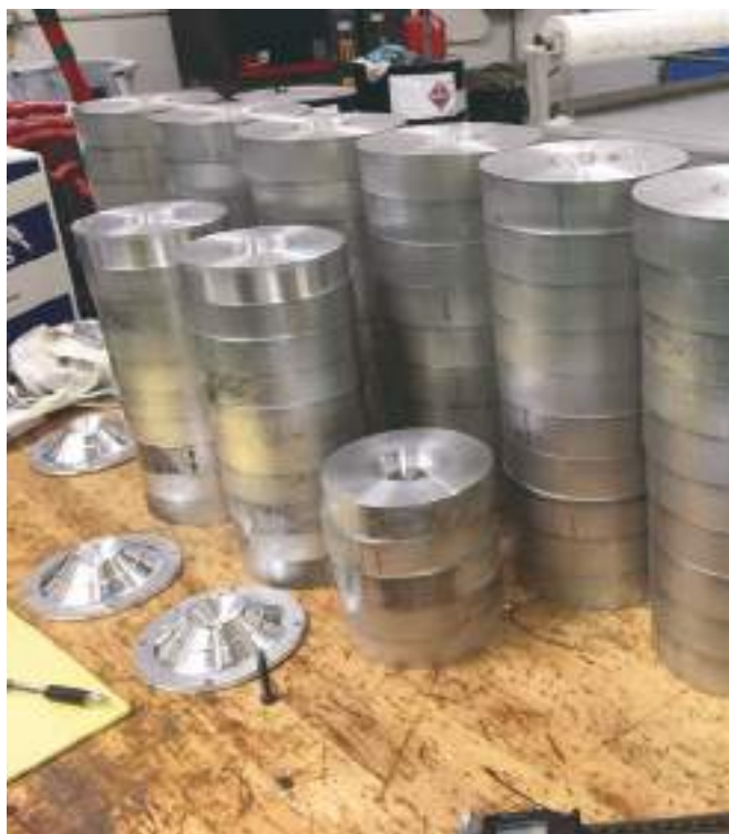
Blocs d'aluminium pour cônes de médium/woofer.