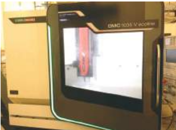
La fraiseuse CNC utilisée pour la finition cosmétique des parois des enceintes YG Acoustics.