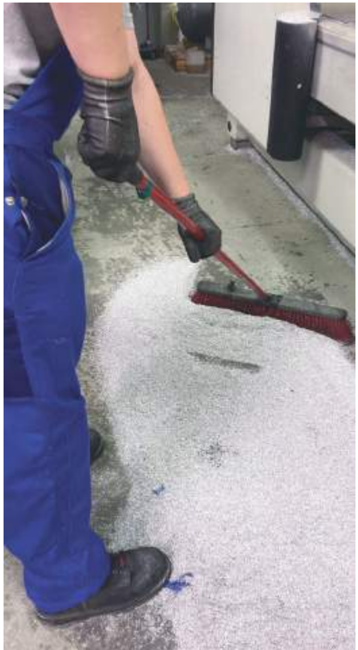
Les copeaux d'aluminium issus du processus d'usinage sont collectés et recyclés.