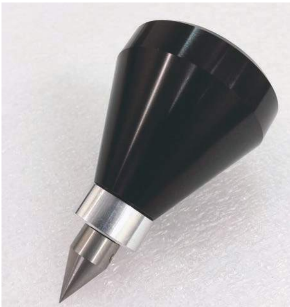
Pointe en aluminium et en acier inoxydable usinée in situ.