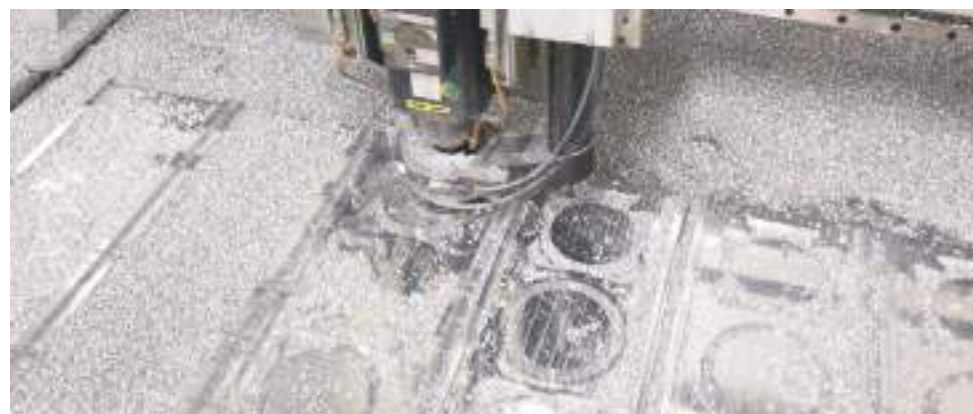
Fraisage d'une grande plaque sur la table de fraisage CNC Portatec grand format (1,52 x 3,04 m). Cette machine programmable à aspiration est la plus grande table de fraisage CNC de l'industrie audio high-end. Les faces avant sont en usinage sur cette photo.