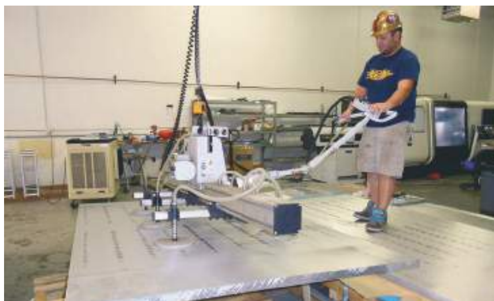
Le hall d'usinage. Le déplacement des grandes plaques (jusqu'à 700 kg pour une seule plaque) peut être effectué par un seul homme en utilisant cette grue à vide.

Devant le prix exorbitant de certains produits audio haut de gamme, l'audiophile se demande souvent s'il en a réellement pour son argent. Les enceintes acoustiques YG Acoustics rentrent dans cette catégorie de produits inabornables pour le commun des mélomanes. Ce petit reportage photos montre la façon dont sont fabriqués les modèles de la gamme Sonja. Nul doute qu'après l'avoir parcouru, tout le monde sera d'accord pour trouver une véritable justification dans la tarification de ces enceintes tout à fait hors du commun.