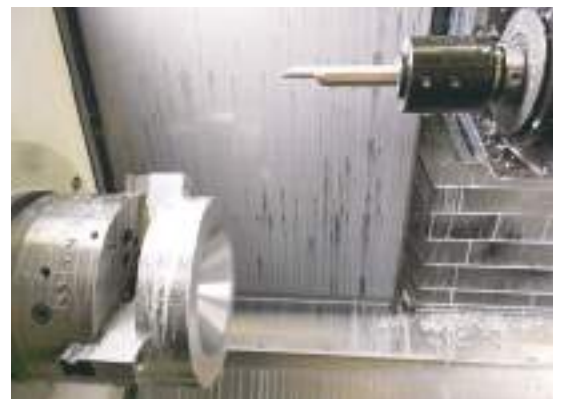
L'usinage d'un cône de woofer commence.