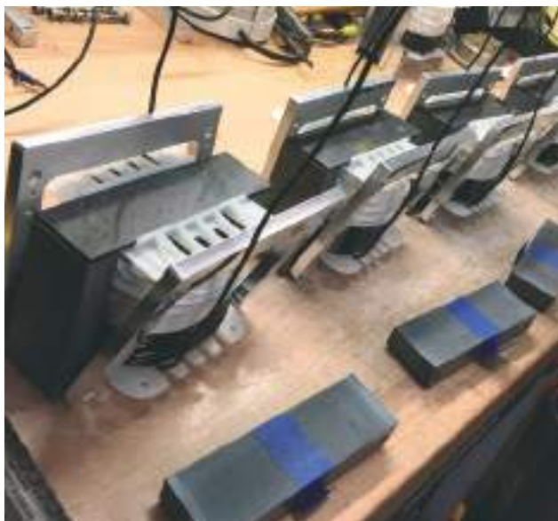
Inductances ViseCoil de filtre de grave : bobinées par machine numérique puis enserrées dans une structure fraisée pour éliminer les vibrations et resserrer les tolérances. La perte résiduelle est réduite de 24 % et la linéarité est améliorée de 60 % par rapport aux meilleures inductances du commerce.