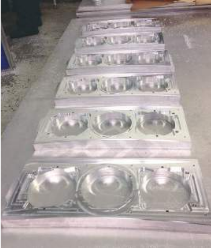
Baffles avant de la série Sonja 2, partiellement usinés.