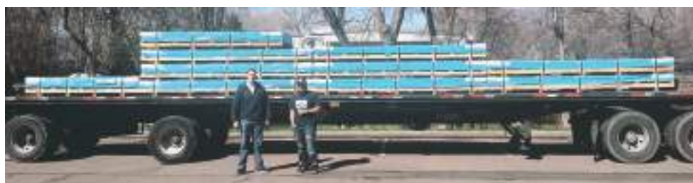
Tout commence ici. Une cargaison typique d'aluminium 6061T651 de qualité aéronautique arrive à l'usine.

Devant le prix exorbitant de certains produits audio haut de gamme, l'audiophile se demande souvent s'il en a réellement pour son argent. Les enceintes acoustiques YG Acoustics rentrent dans cette catégorie de produits inabornables pour le commun des mélomanes. Ce petit reportage photos montre la façon dont sont fabriqués les modèles de la gamme Sonja. Nul doute qu'après l'avoir parcouru, tout le monde sera d'accord pour trouver une véritable justification dans la tarification de ces enceintes tout à fait hors du commun.