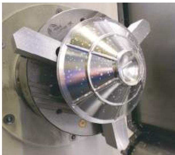
Arrière d'un cône de woofer. Les nervures intégrales de renfort sont créées par un programme informatique sophistiqué qui dirige la machine CNC pour enlever de la matière et en laisser à des endroits stratégiques.