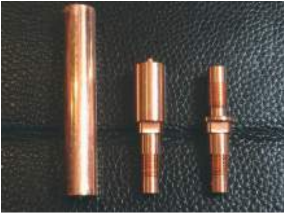
Tiges en cuivre ultra-pur usinées en borne pour haut-parleur.