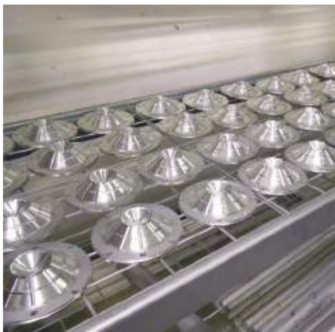
Cônes de médium/woofer partiellement usinés.