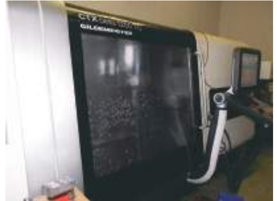
La fraiseuse-tourneuse CNC sur 5 axes. Dans cette machine, non seulement l'outil tourne, mais la pièce peut également tourner. Cela permet d'usiner avec précision des courbes et des profils complexes.