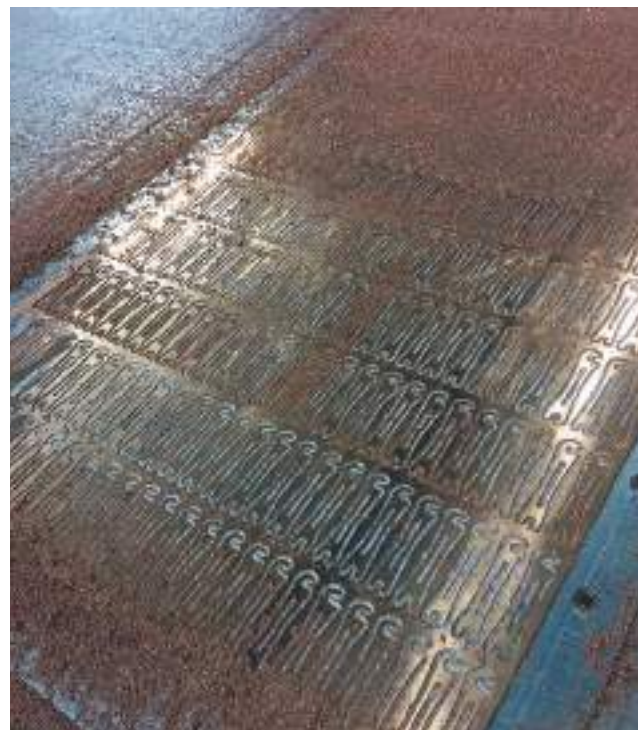
Straps pour sortie haut-parleur usinés en cuivre très pur.