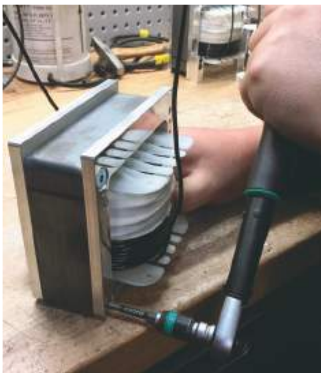
Assemblage final d'une inductance de grave ViseCoil.