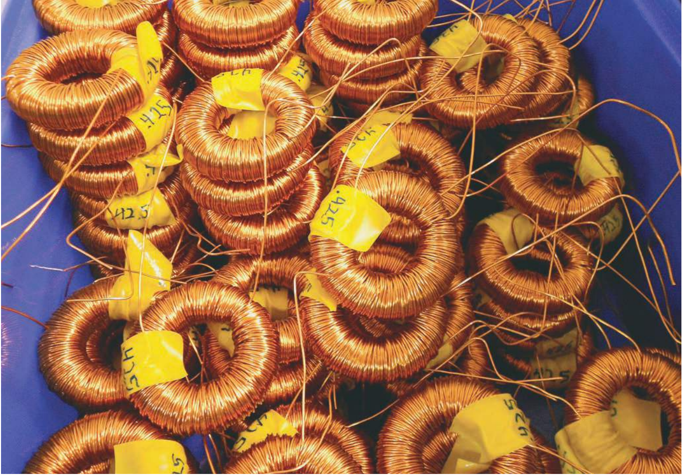
Tolérances précises – au millième!