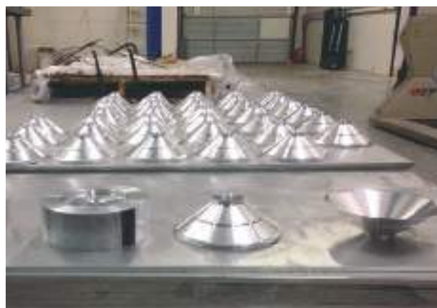
Les étapes de l'usinage d'un cône de woofer. Ça commence avec 7 kg d'aluminium et se termine avec 48 g.