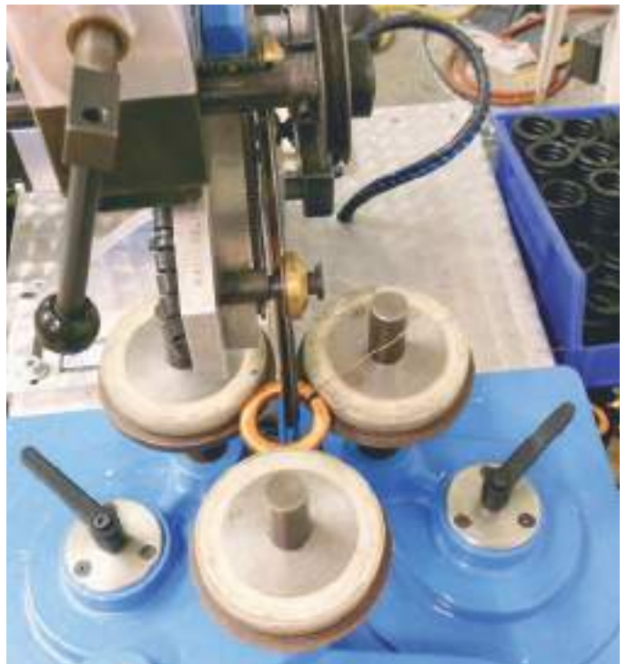
YG Acoustics bobine des inductances toroïdales pour les filtres sophistiqués des tweeters.